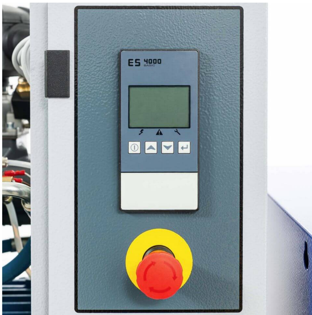
Panneau de contrôle intuitif

Les plus gros modèles de la deuxième génération de la série Basic Airpess sont dotés d'un nouveau panneau de contrôle le ES 4000 Basic. Grâce à ce panneau digital il vous est plus simple d'effectuer les contrôles du compresseur et ainsi rendre le compresseur plus fiable et intuitif. En effet, très simple d'utilisation grâce à des icônes d'affichages il est très facile de vérifier les heures de fonctionnement, la pression et les températures. Mais ce n'est pas tout, avec l'affichage digital il est désormais possible de vous avertir des malfunctions ou encore des besoins d'entretien et aussi de permettre le redémarrage automatique après une rupture de courant. Pour finir, avec cette innovation, il vous est tout à fait possible de surveiller et contrôler le fonctionnement du compresseur à distance. Ainsi, l'utilisation d'un compresseur à vis n'a jamais été aussi simple.