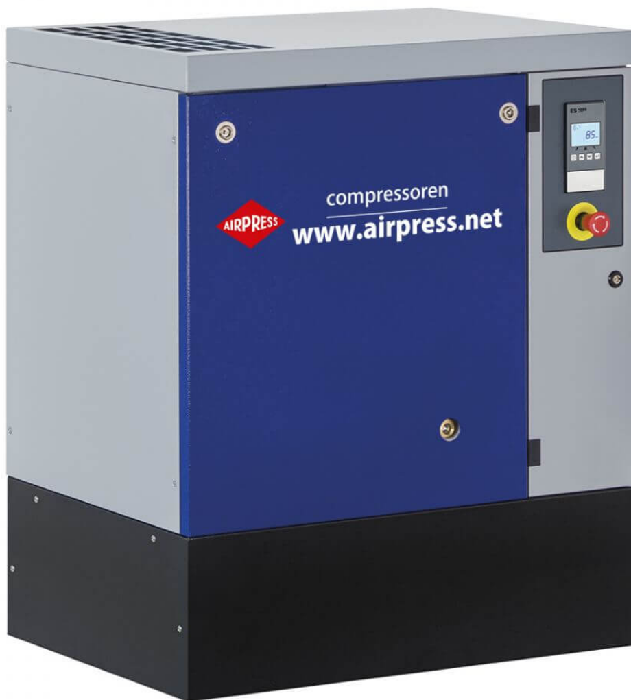
APS 7.5 unité seule