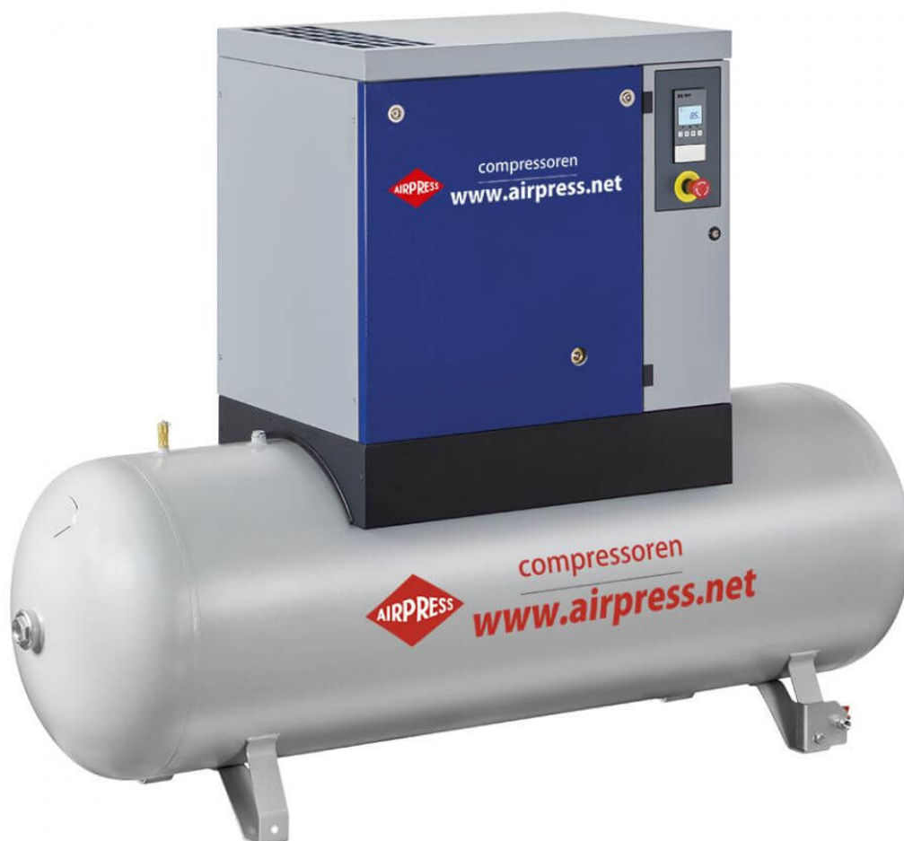
APS 7.5 Combi Maxi