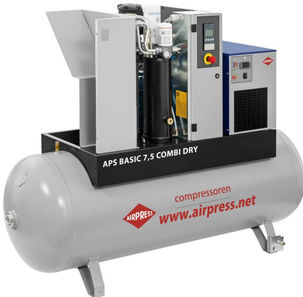
APS 7.5 Combi Dry Maxi