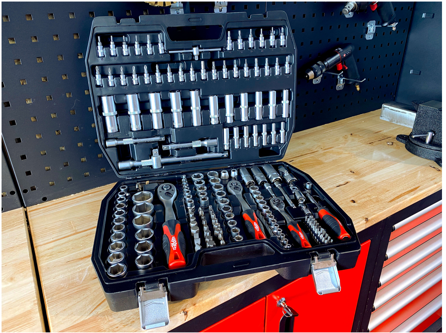
Cet ensemble de clés à douilles de 171 pièces avec un étui de rangement est très pratique.