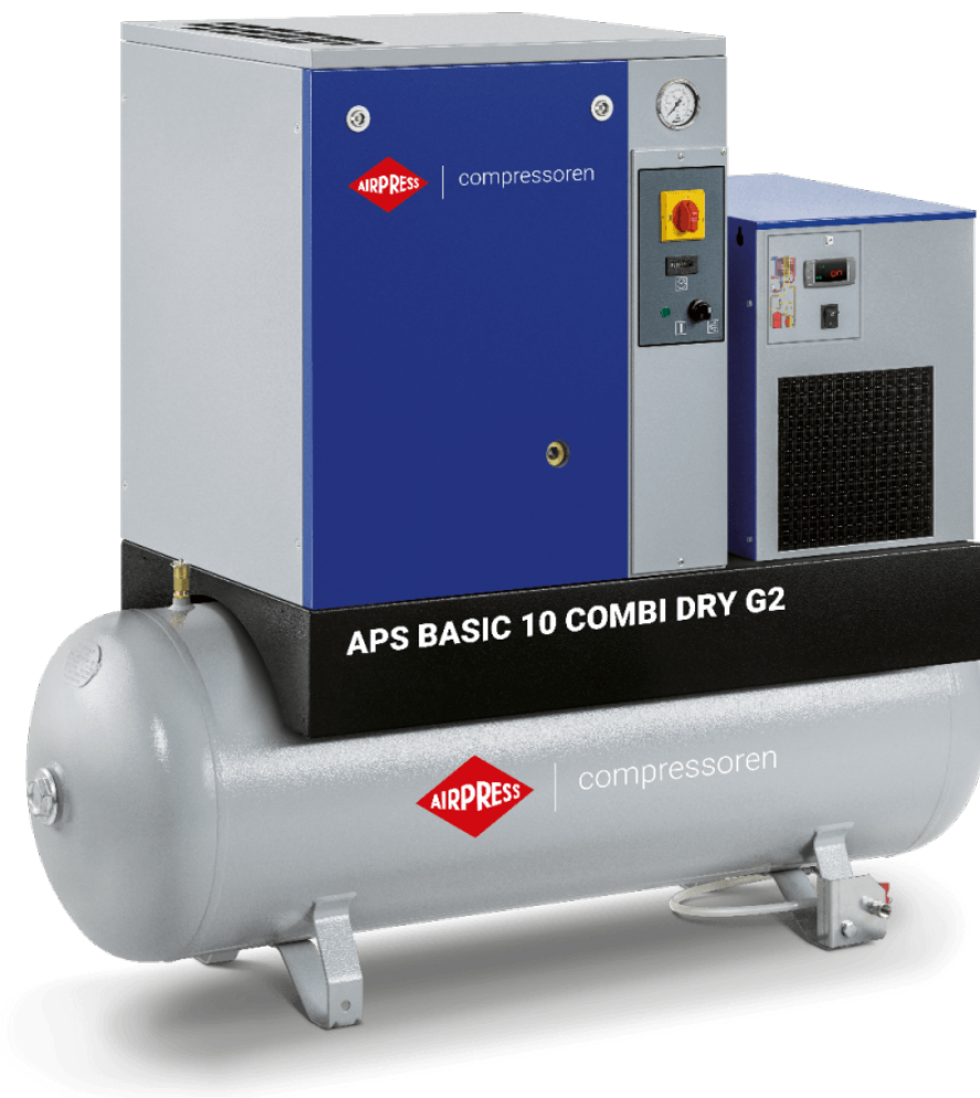
APS 10 combi dry